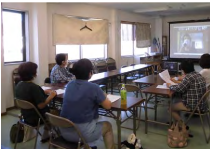
牛深からも参加した天草会場