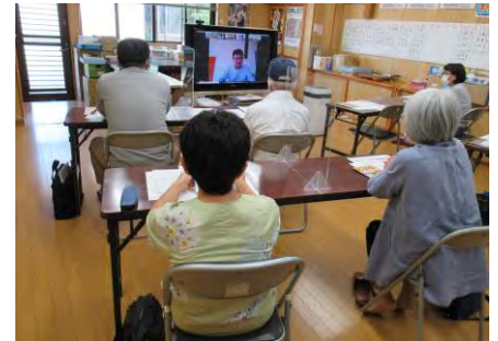
父ちゃん達も参加した八代会場

1回目の制度学習を終え、参加者からは「難しかったけど、インボイス制度が少し分かった」「インボイスは百害あって一利無しという印象で、仕事がしにくくなるなあ～と思った」など、零細業者や一人親方つぶしのインボイスの姿も見えてきました。