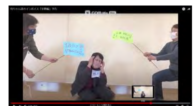
次回9/27の予告動画も好評