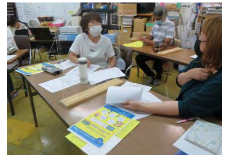
休憩中も情報交換(東部会場)