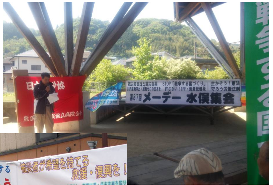
熊建労の支援状況を訴えた 水俣会場